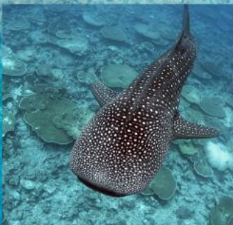
Whale Shark Snorkeling