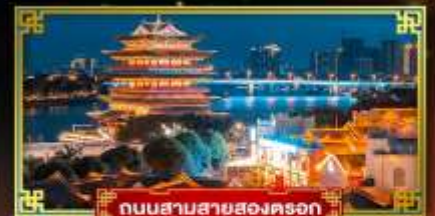
ถนนสามสายสองตระก