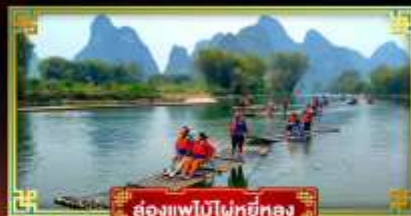
ล่องแพไม้ไผ่หยี่หลง