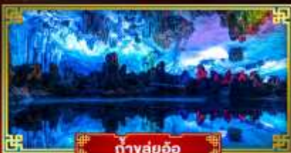
ถ้ำสุ่ยอ้อ

"ดินแดนแห่งสายน้ำและขุนเขา" สัมผัสประสบการณ์นั่งบอลลูนชมวิวมุมสูง