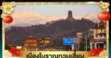
เมืองโบราณกวนเสียน