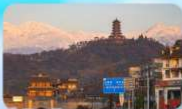
เมืองโบราณกวนเสี้ยน