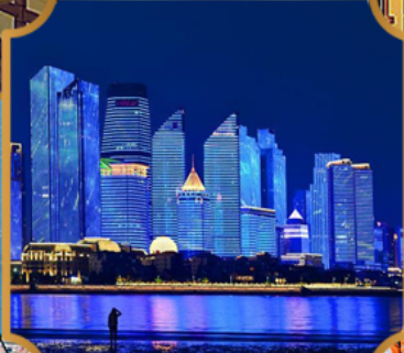
หาดโซเบอร์ฟังก์