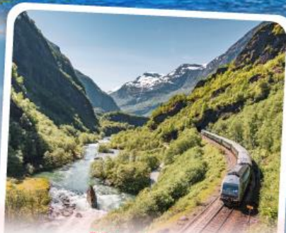
พลัมส์บานา รถไฟเส้นทางสายโรเมนติก