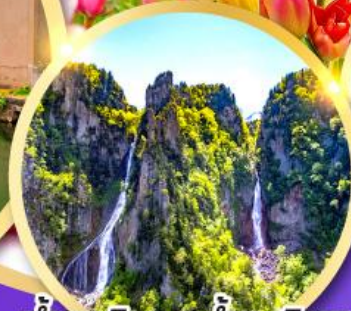
น้ำตกกิ่งกะ-น้ำตกริวเซ