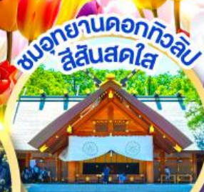
ชมอุทยานดอกทิวลิป สีแสนสดใส