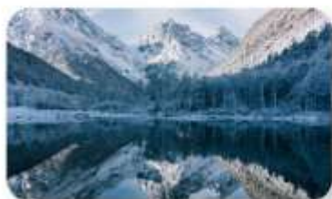
ปี้ฝิงโกว