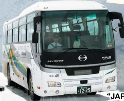
“JAPAN ALPINE ROUTE”