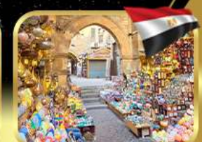
ตลาดชานอลคาลิลี