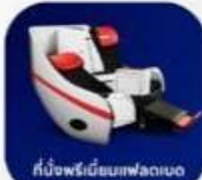
ที่นั่งพรีเมียมเฟลทเบด

บริการอาหารร้อน และ น้ำดื่ม บนเครื่อง ขาไป และ ขากลับ