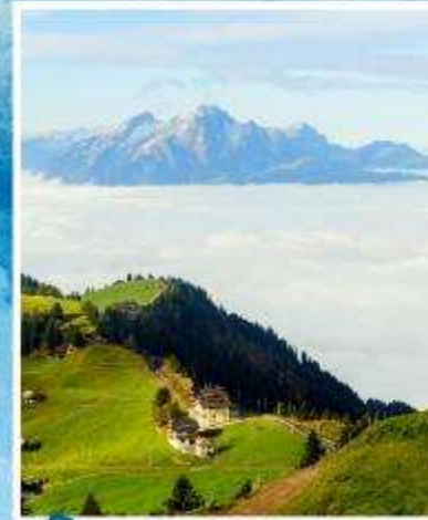
RIGI KULM Queen of the Mountains