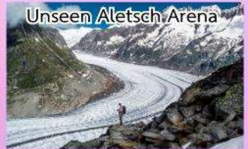
Unseen Aletsch Arena

ชมความงดงามของทะเลสาบเจนีวา ชมปราสาทชิลองที่เมืองมอว์คเทรอซ์ ล่องเรือชมความงามของทะเลสาบ ลูเซิร์น, พักในหมู่บ้านเซอร์แมท (เมืองตากอากาศปลอดมลพิษ ที่ได้ ชื่อว่าสวยงามเหมือนสวรรค์บนดิน)