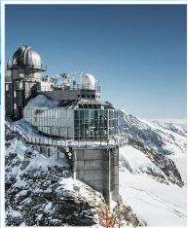
JUNGFRAUJOCH "Top of Europe"