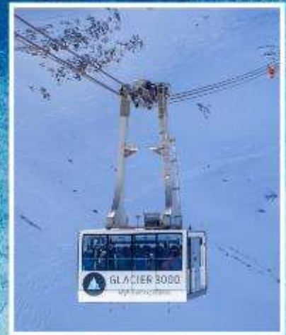
GLACIER3000 Peak walk by Tissot