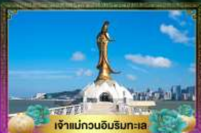
เจ้าแม่ทวนอิมริมทะเล