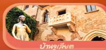
บ้านลูเลียง