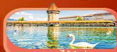
สะพานไม้ซังปก

Highlight เยือนหมู่บ้านแสนสวยเซอร์แมท เช็กอินศาลาไทยสุดงามที่โลซาน เที่ยวลูเซิร์น ชมสะพานไม้ซังและอนุสาวรีย์สิงโต ซาลี แพลสซึน ชมประติมากรรม The Fork และปราสาทซิลลองริมทะเลสาบ เยือนมิลาน มหาวิหารดูโอโม เที่ยวเวนิส เมืองลอยน้ำสุดโรแมนติก อินกับรักอมตะที่บ้านจูเลียต และช้อปปิ้งจุใจที่ Serravalle Outlet