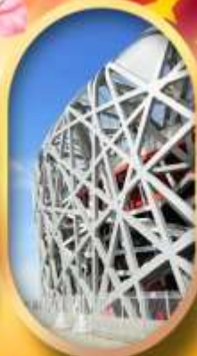
ผ่านชมสนามกีฬาโอลิมปิก