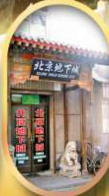
เมืองโบราณใต้ดิน