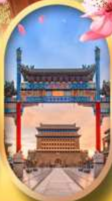
ถนนคนเดินเจียมเหมิน