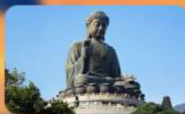
พระใหญ่นองปิง