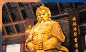
วัดเซ่งกงหมิว