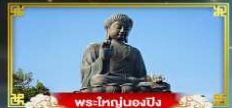
พระใหญ่ของปิง