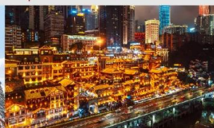
หงหยาดัง(ตอนกลางคืน)

*ทางบริษัทฯ ขอสงวนสิทธิ์ในการสลับโปรแกรมทัวร์ตามความเหมาะสมขึ้นอยู่กับสถานการณ์หน้างาน โดยคำนึงถึงผลประโยชน์ของลูกค้าเป็นสำคัญ