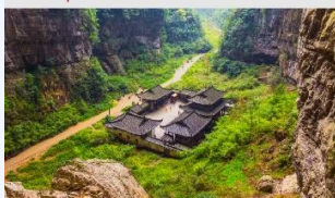
อุทยานหลุมฟ้าสะพานสวรรค์