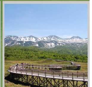
"SHIRETOKO 5 LAKES"