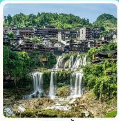
ฟูหรงเจิน

• ไฮโลว์ อุทยานเทียนเหมินซาน ชมประตูสวรรค์ หุบเขาอวตาร หมู่บ้านโบราณฟูหรงเจิน และแพ่งหวง ล่องเรือทะเลสาบเป่าแพ่งหู