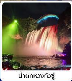
น้ำตกหวงกั๋วซู่