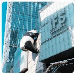
IFS ตึกหมีแพนด้า