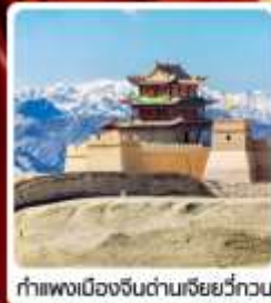
กำแพงเมืองจีนด่านเสี่ยววีกวน

• ไซโล่...เส้นทางสายไหม ชมสระบัววังพระจันทร์ ทะเลทรายหมีงาช้าง กำแพงเมืองจีนด่านสุดท้าย "เจียยวีกวน" มรดกโลกภูเขาสายรุ้งจางเย่