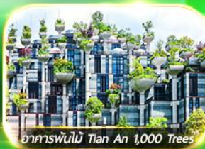
อาคารพันไม้ Tian An 1,000 Trees