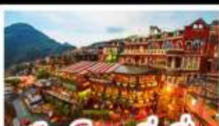
เมืองโบราณจิวเฟิ่น

ฟาร์มแกะซิงจิ้ง - ทะเลสาบสวี่นจินตรา จิวเฟิ่น - หมู่บ้านประมงหลากสี - ไทเป 101 หมู่บ้านสายรุ้ง - ตลาดล่าหู่ & ซีเหมินติง ปลาประ-ธานธิบดี - เขียวหลงเปา