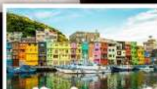
หมู่บ้านประมงหลากสี