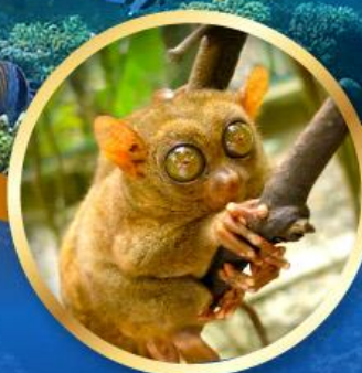
สิงทาร์เซีย