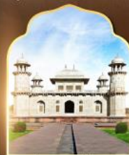
ถ้ำมาชาน้อย