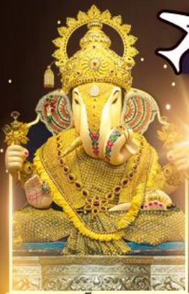
องค์ตั้งบูชท์พิเศษ