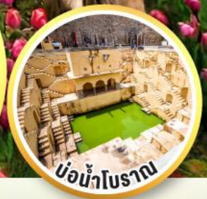
บ่อน้ำโบราณ