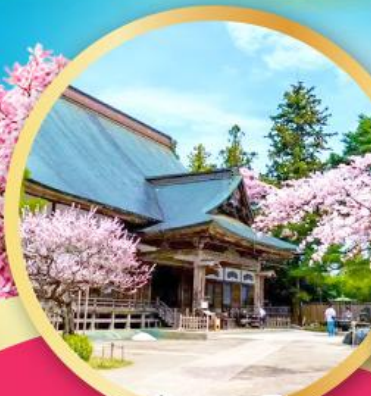
วัดชูซอนจิ