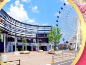
มีตชยุเอาก์เล็ตพาร์ค เซนได