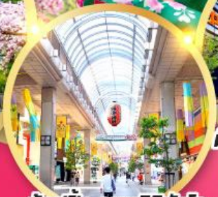
ช้อปปิ้ง ถนนอิชิบังโจ