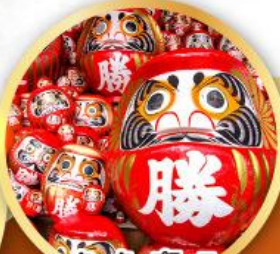
วัดคิตสึโอจิ (วัดดาร์มะ)

ชมความงามของกำแพงหิมะ เส้นทางสายอัลไพน์ ทากายามา (JAPAN ALPS SNOW WALL)