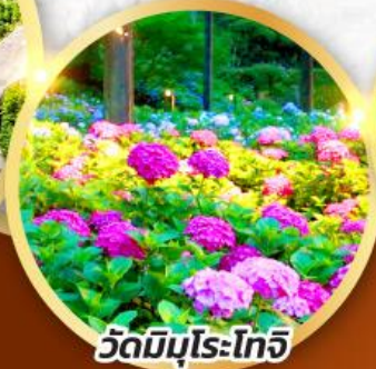
วัดมิบุโรโทจิ