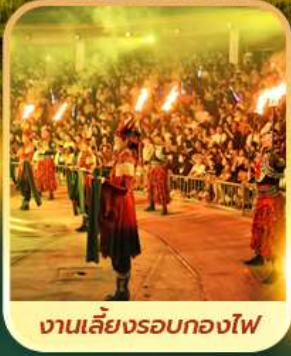
งานเลี้ยงรอบกองไฟ