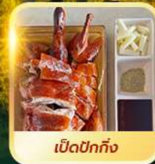
เปิดปอกกิ้ง