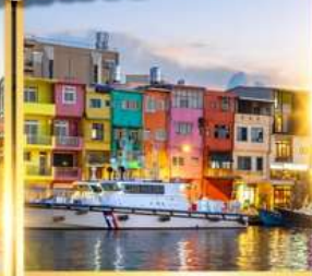
ท่าเรือประมงเจิ้งปิง