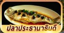
ปลาประรานาธิบดี