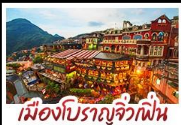
เมืองโบราณจีวเฟิน

เที่ยวธรรมชาติระดับโลก เอเชีย ทะเลสาบสุริยันจันทรา - เมืองดงครบ ไทเป จีวเฟิน - ซีเหมินติง