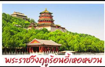
พระราชวังฤดูร้อนอี้ทงหยวน

มือพิเศษ เปิดปิกกิ้ง สุกี้มองโก MICHELIN GUIDE ร้าน TAO TAO JU