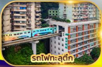
รถไฟทะลุตึก