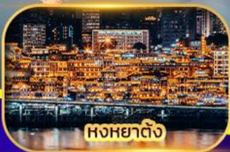
หงหยาดิง