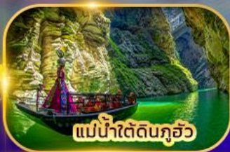
แม่น้ำใต้ดินกุ้ยโจว