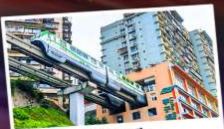
รถไฟทะลุตึก