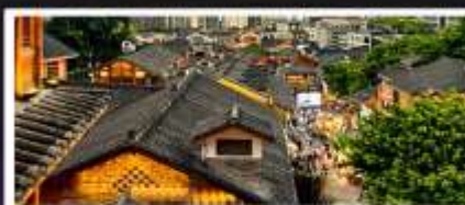
เมืองโบราณสี่ปาที้