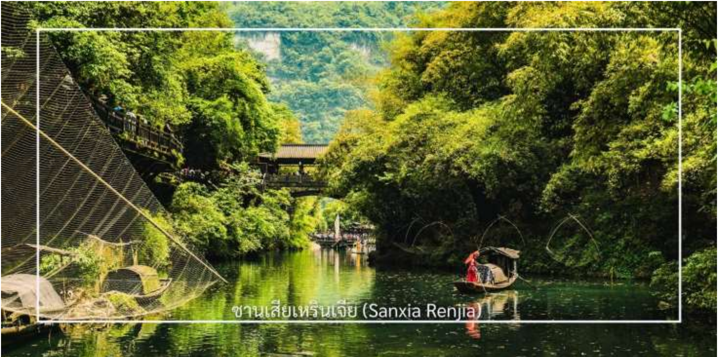
ซานเซียเหรินเจีย (Sanxia Renjia)

นำท่านสู่ หมู่บ้านซานเซียเหรินเจีย (Sanxia Renjia) (รวมล่องเรือ) สถานที่นี้เป็นที่รู้จักกันในชื่อ หมู่บ้านสามผา แหล่งท่องเที่ยวระดับ 5A ตั้งอยู่ในเขตหุบเขาสามผา ริมแม่น้ำแยงซีเกียง โดดเด่นด้วยทัศนียภาพทางธรรมชาติอันงดงามของภูเขา หินผา สายน้ำ และหุบเขาที่โอบล้อมกันอย่างกลมกลืน สถานที่แห่งนี้สะท้อนวิถีชีวิตดั้งเดิมของชาวลุ่มแม่น้ำแยงซีเกียง ผ่านสถาปัตยกรรมพื้นบ้าน วัฒนธรรม ประเพณี ที่ยังคงเอกลักษณ์ไว้อย่างครบถ้วน พร้อมให้ท่านได้ชมการแสดงเรื่องราวเกี่ยวกับวิถีชีวิตควบคู่กับสายน้ำ