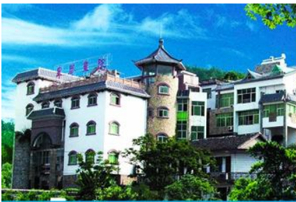
พิพิธภัณฑ์ภาพเขียนหินทราย