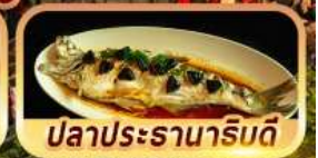
ปลาประรานาภิรมย์