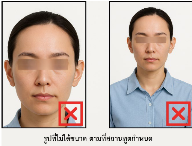
รูปที่ไม่ได้ขนาด ตามที่สถานทูตกำหนด