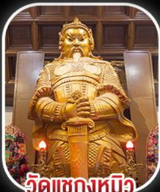
วัดเขกงหนิว

สวนสนุก CHIMELONG SPACESHIP PARK เจ้าแม่กวนอิมรีพลีสเบย์ - เจ้าแม่กวนอิมฮ่องฮำ วัดเขกงหนิว - พระใหญ่องปิง+กระเช้า เมนูสุดพิเศษ!! เป้าอ้อ+ไวน์แดง , ห่านย่าง