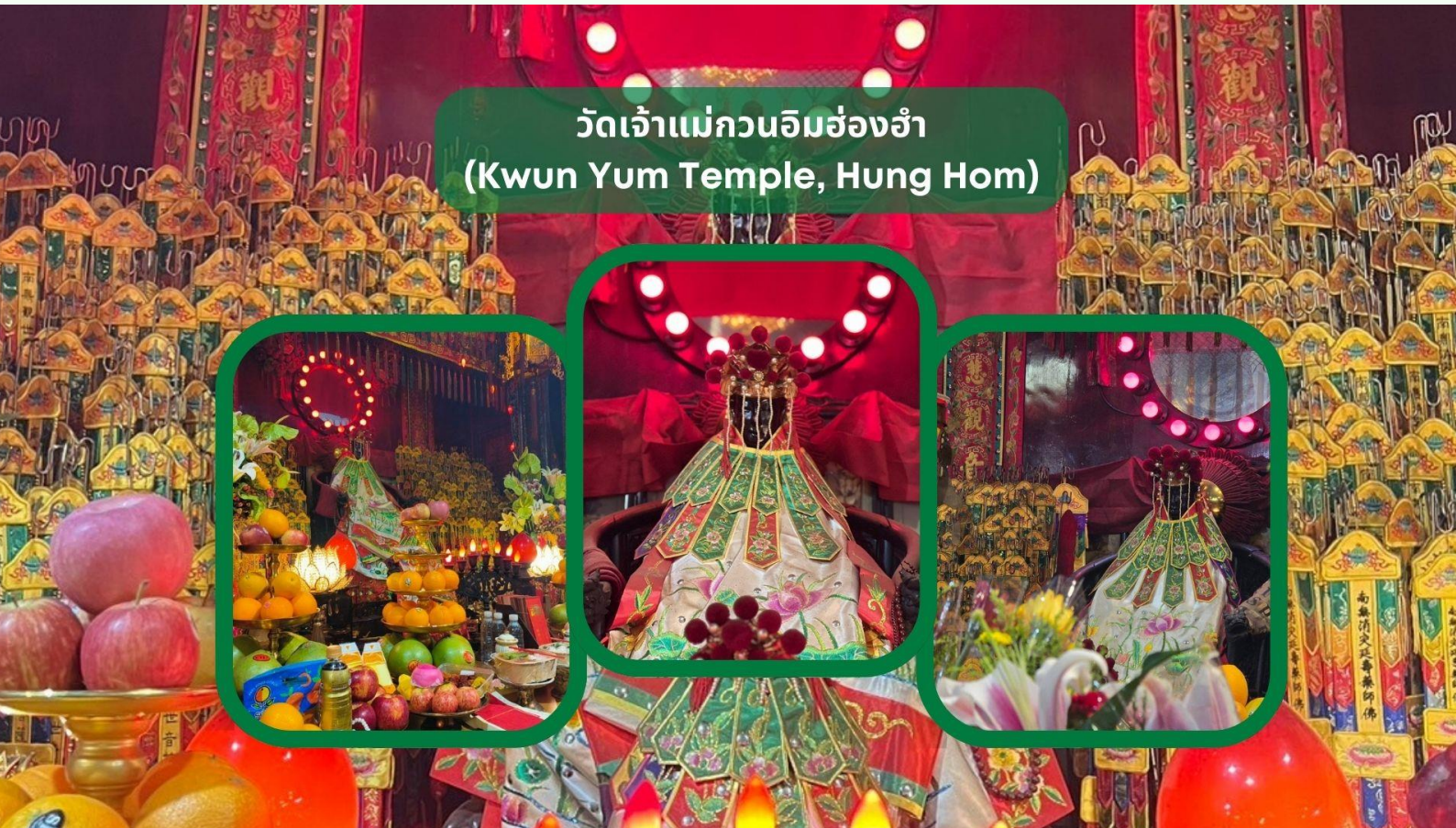
วัดเจ้าแม่กวนอิมฮ่องกง (Kwun Yum Temple, Hung Hom)

หมายเหตุ: ในการเดินทางข้ามด่านระหว่างแต่ละเมือง ท่านจำเป็นต้องลากสัมภาระด้วยตนเอง และผ่านพิธีการตรวจคนเข้าเมืองตามขั้นตอน ซึ่งใช้ระยะเวลาในการเดินและดำเนินการโดยประมาณ 45-60 นาที