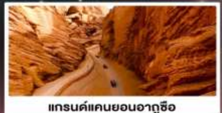
แกรนด์แคนยอนอาถูซื่อ