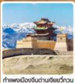
กำแพงเมืองจีนด่านเจี๋ยวี่กวน