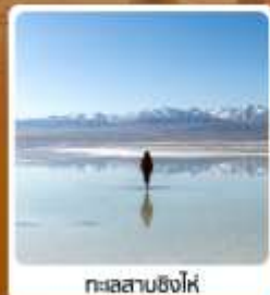
ทะเลสาบชิงไห่