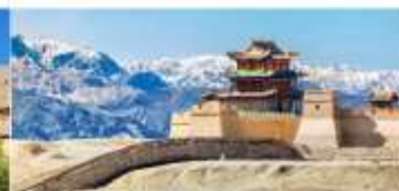
กำแพงเมืองจีน ด้านเจียอวี๋กวน

*ทางบริษัทฯ ขอสงวนสิทธิ์ในการสลับโปรแกรมทัวร์ตามความเหมาะสมขึ้นอยู่กับสถานการณ์หน่วยงาน โดยคำนึงถึงผลประโยชน์ของลูกค้าเป็นสำคัญ