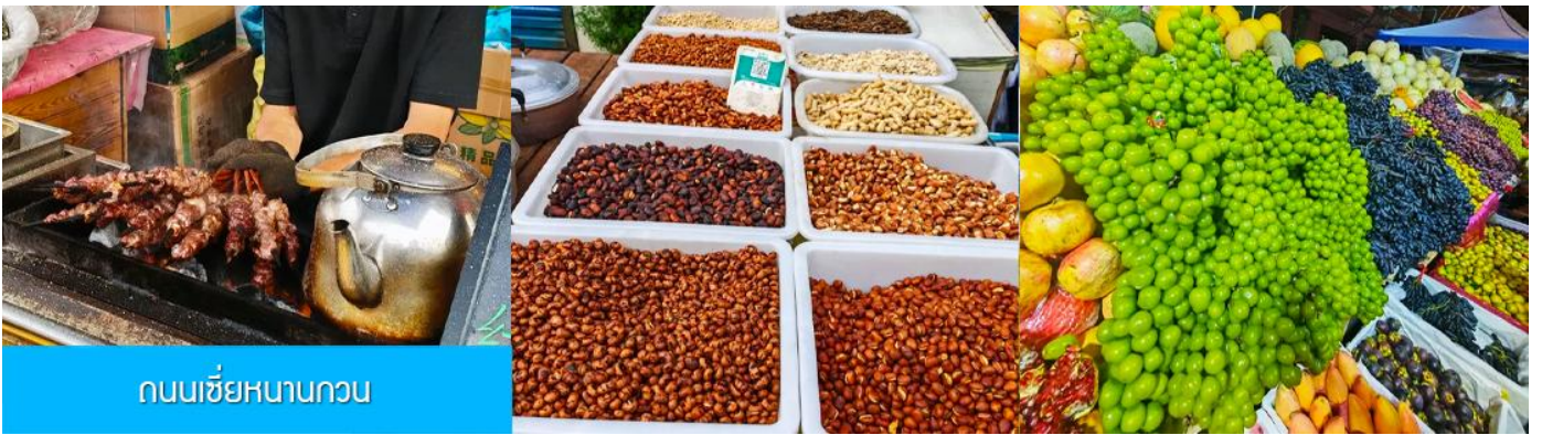
ถนนเซี่ยหนานกวน