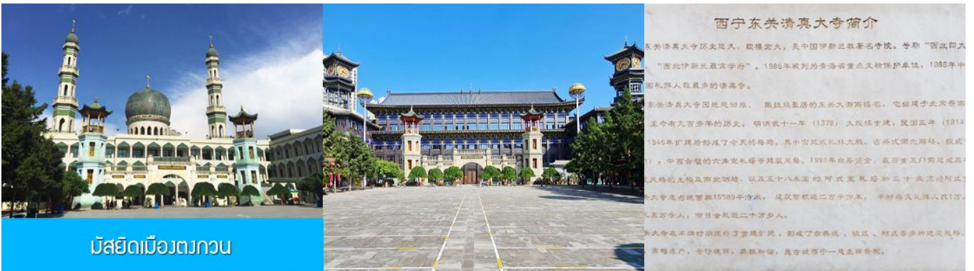
มัสยิดเมืองตงกวน

เช้า บริการอาหารเช้า ณ ร้านอาหารในโรงแรม (17)