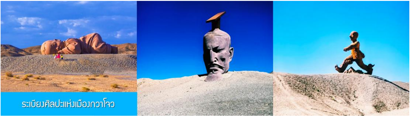
ระเบียบศิลปะแห่งเมืองกวาโจว