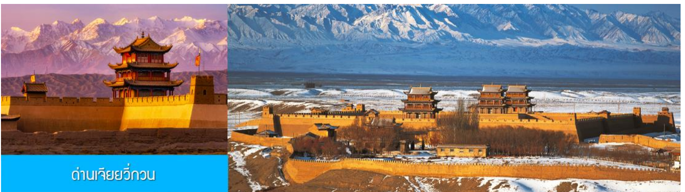
ด่านเจียยวี่กวน

รับประทานอาหารเช้า ณ ห้องอาหารของโรงแรม (12)