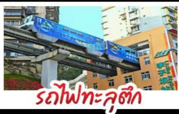
รถไฟทะลุติ๊ก