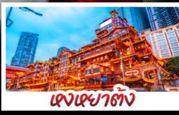
เจงเฉาตัง