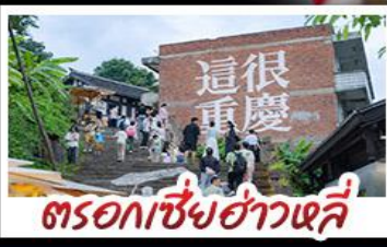
ตรอกซี้ฮ่าวหลี่