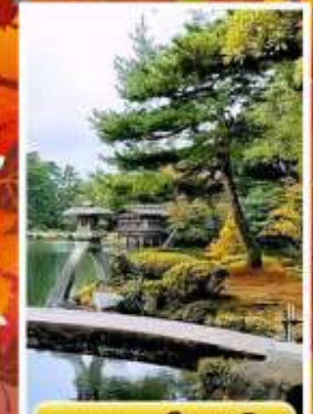
สวนเคนโระคุเอ็ง

ออนเซ็น 3 คั้น นน.กระเป๋า 23 กก. 7Days 5Night