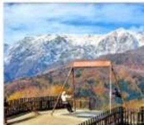
ฮาดุบะอิวาทาเกะ