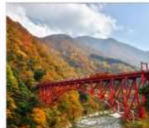
รถไฟชมวิวยุขุมเงาคุโรมะ