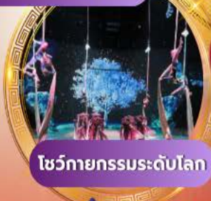
โชว์กายกรรมระดับโลก