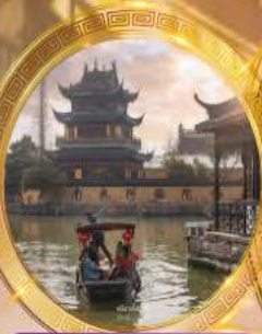
หมู่บ้านโบราณจูเจียเจี้ยว

บินหรู Full service พัก 5 ดาวย่านช้อปปิ้ง