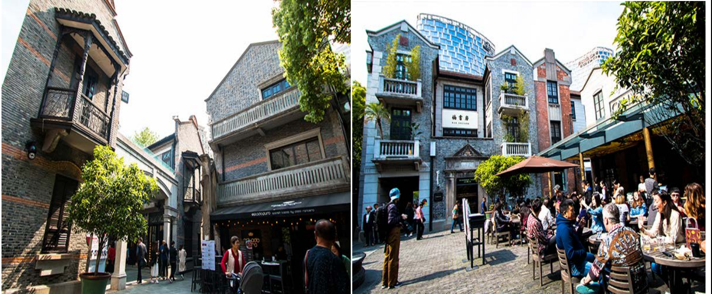
ค้ำ บริการอาหารค้ำ ณ ร้านอาหาร TAOTAOJU [มือที่ 7] เมนู ต้มขาเจ้าดัง

นำท่านเที่ยวชม ซินเทียนตี้ ย่านฮิปเตอร์ใจกลางนครเซี่ยงไฮ้ ที่วัยรุ่นต้องมา กลายเป็นสถานที่ท่องเที่ยวติดอันดับต้นๆไปแล้ว สำหรับแหล่งช้อปปิ้งแห่งนี้ ไม่แพ้แหล่งช้อปปิ้งรุ่นพี่ อย่าง ถนนนานกิง ถนนอูเจียง Yu Yuan Bazaar ถือว่าเป็นอีก 1 ไฮไลท์เด็ดของนครแห่งนี้ เนื่องจากเอกลักษณ์ที่ไม่เหมือนใคร สิ่งปลูกสร้างที่ใช้อิฐบล็อกแบบสถาปัตยกรรมแบบ Shikumen (ซิกเหมิน) การผสมผสานระหว่างสถาปัตยกรรมตะวันตกกับจีนเข้าด้วยกัน ทางเดินหิน กำแพงหิน ประตูหิน บ้านเมืองเก่าแต่ดูแลรักษาอย่างดี