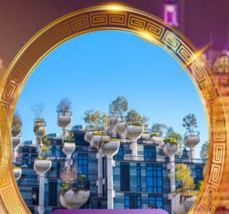
Tian An 1,000 Trees