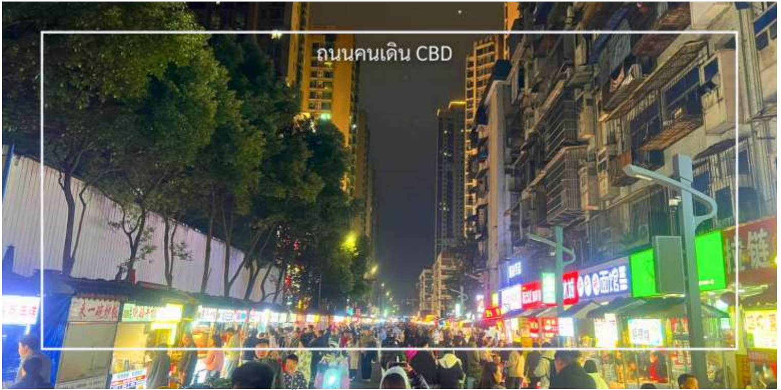
ถนนคนเดิน CBD

เย็น บริการอาหารเย็น ณ ภัตตาคาร (มื้อที่ 3)