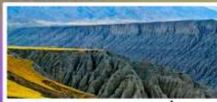
แกรนด์แคนยอนตูซานจื่อ