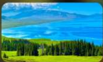
ทะเลสาบโซหลี่มู่