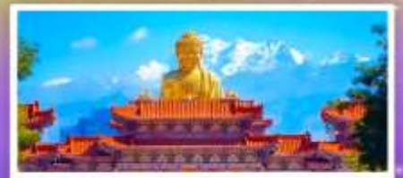
วัดพระใหญ่ทงกวงชาน