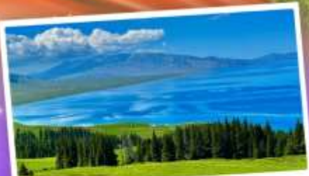
ทะเลสาบโซหลี่มู่

เที่ยวทุ่งหญ้าคอกฟ้า นาราถิ ชมความสวยงามทะเลสาบโซหลี่มู่