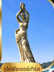
จูไห่ฟิชชอร์ทรีซ่า