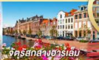
จัตุรัสสากสางฮาร์เล็ม