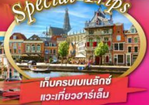
เก็บครบเบเนลักซ์ แวะที่ฮาร์เล็ม