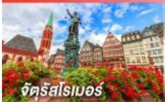
จัตุรัสโรเมอร์