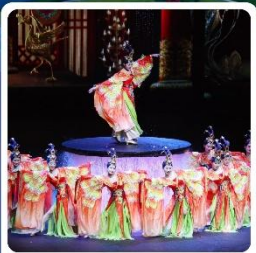
โชว์ FOSHAN QIANGUING